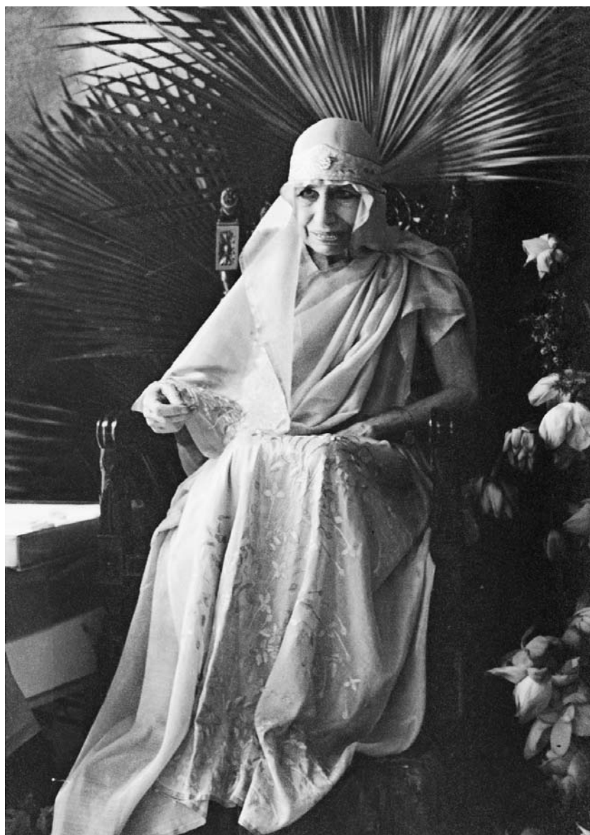
La Mère en 1958 lors de la Kâlî pûjâ