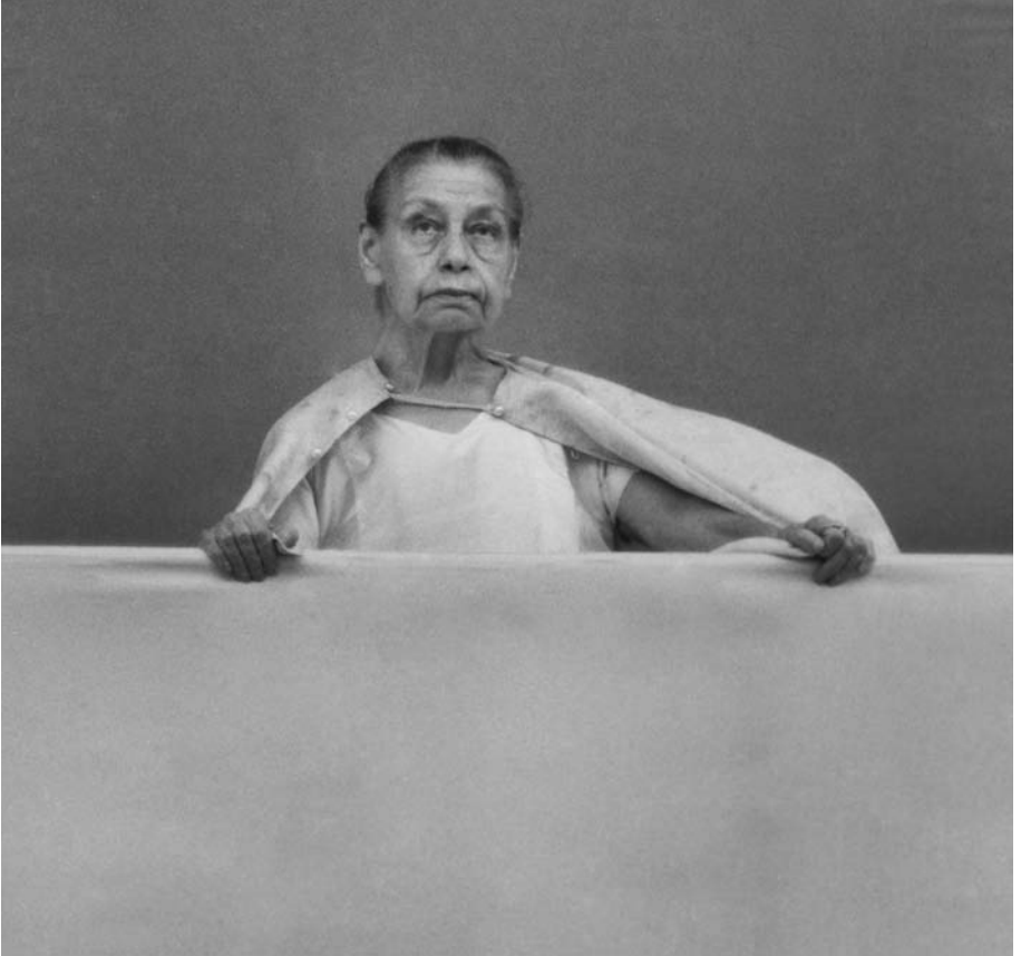
La Mère en 1967